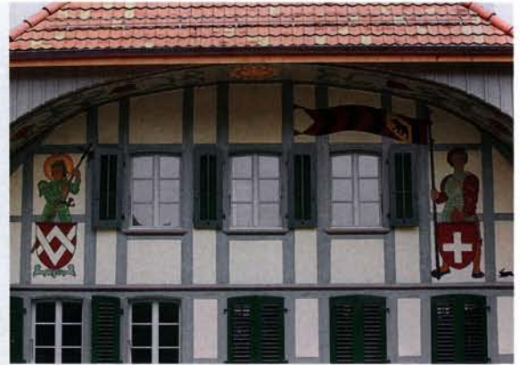
Spür- und sichtbar: Geist und Charakter seiner früheren Tage sind dem Aebersoldhaus nach der Renovation erhalten geblieben.

Die Koordinaten der Marschtabelle für die terminierte Fertigstellung der Bauaufgabe haben sich bis zum Frühjahr 2010 verschoben, doch hat sich der Aufwand – wie ihn die Bilder dieses Beitrags dokumentieren – gelohnt: Das renovierte